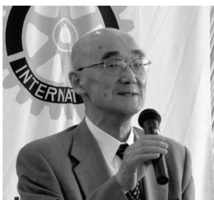
▲龍谷大学名誉教授 戸上宗賢氏(9/19)