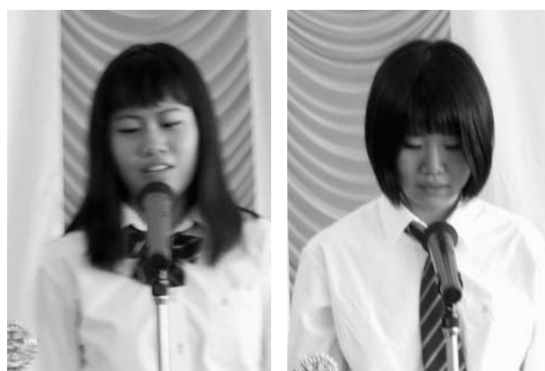
▲インターアクト年次大会の報告(伊賀白鳳高校)(9/5)