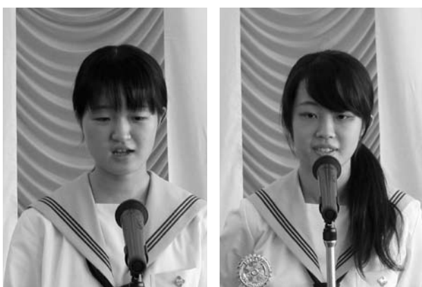
▲インターアクト年次大会の報告(上野高校)(9/5)