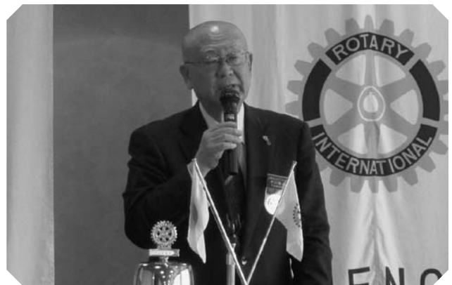
▲卓話 市川会長「さくらの会について」(3/7)