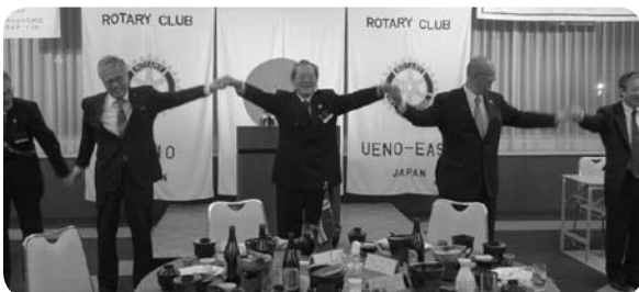
上野・上野東合同例会 (3/14)