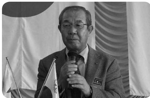
▲山下IM実行委員長「IMの報告」(10/4)