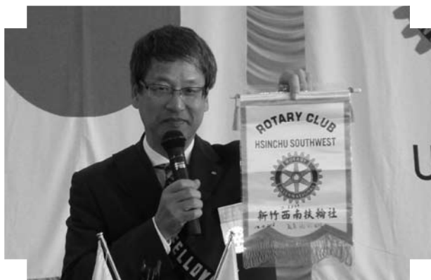
▲川向君「台湾(新竹西南RC)例会へメイクの報告」(10/18)