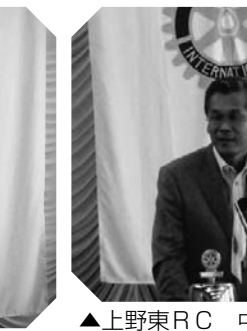
▲上野東RC 中尾会長より ガバナーへの協力をお願い (7/26)