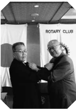
▲会長幹事バッジの交換 (7/5)