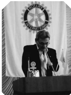
▲クラブアッセンブリー (7/12)