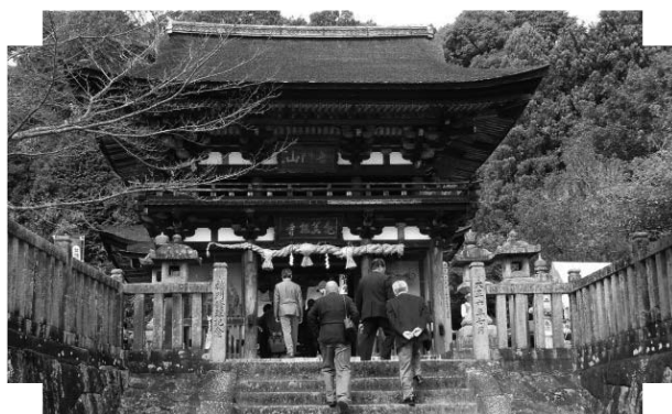
▲正月堂 十一面観世音像拝観 (11/6)