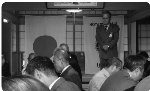
▲移動例会 於 西念寺 (11/6)