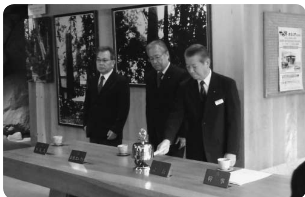
▲移動例会 豊寿庵 (11/26)