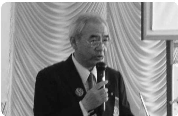
▲廣澤60周年実行委員長 決定事項の報告 (9/3)